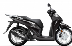
Pearl Nightstar Black