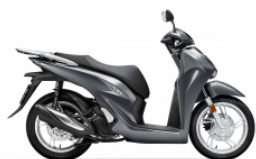
Timelass Gray Metallic