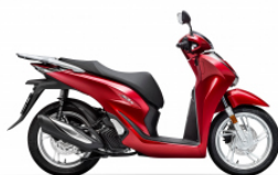
Pearl Splendor Red