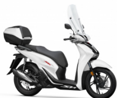
Matt Pearl Cool White