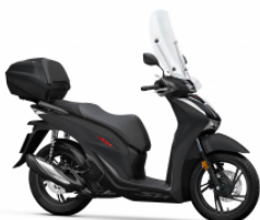
Mat Rock Gray