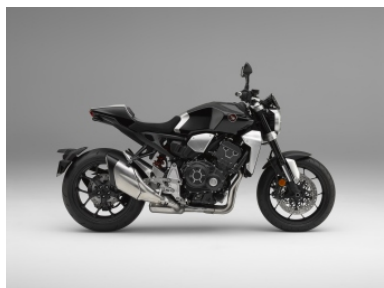
Graphite Black SE