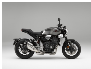
Mat Bullet Silver