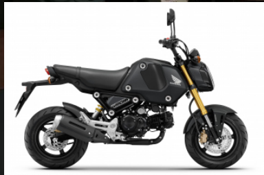
Mat Gunpowder Black Metallic