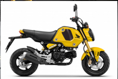
Pearl Queen Bee Yellow