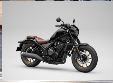
PEARL SHINING BLACK