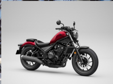
CANDY DIESEL RED